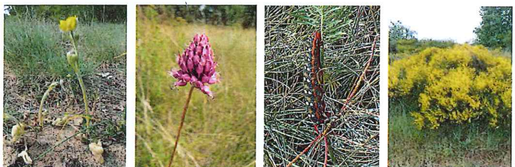
De gauche à droite : Renoncule de Montpellier, Ail à tête ronde, chenille du Sphinx de l'Euphorbe, Genêt purgatif

Chez les insectes, le Damier de la Succise ( Euphydryas aurinia , protégé en France), papillon plutôt habitué aux prairies humides, demeure à St-Père sous la forme d'une sous-espèce adaptée aux milieux secs. Le sphinx de l'Euphorbe à la chenille multicolore et la Zygène du Panicaut témoignent aussi de la richesse des milieux secs d'Entre les levées et de la nécessité de leur préservation.